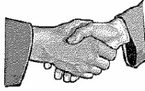
Maison de l'Amitié Paris La Défense