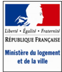
Ministère du logement et de la ville