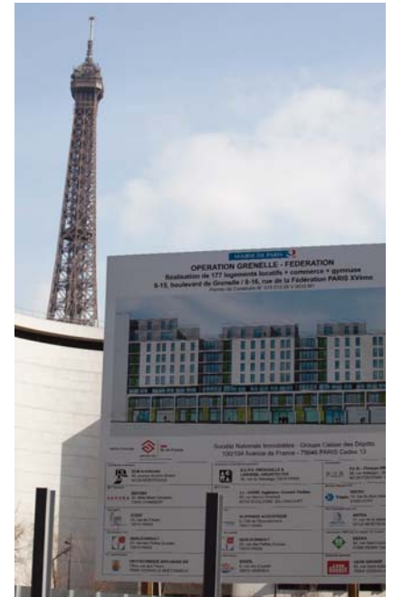
Paris, Boulevard de Grenelle

Le programme national de mobilisation des fonciers publics pour la construction de logements représente 776 sites pour un total de 908 hectares. Sur la période 2008 - 2012, 73 000 logements, dont 28 870 à vocation sociale, seront construits sur les terrains du programme. Essentiellement concentrés en Île-de-France, ces sites sont répartis de la manière suivante sur le territoire (voir carte ci-contre).