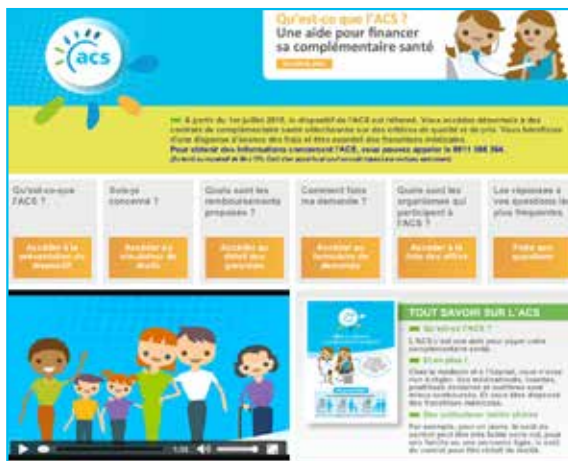
Site Internet www.info-acs.fr